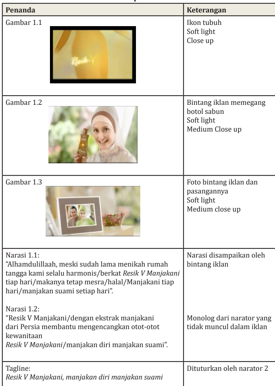
Tabel 1. Tanda pada iklan Resik V