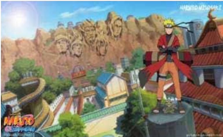
Gambar 3. Tokoh Naruto Uzumaki

Naruto Uzumaki adalah seorang anak yatim piatu dari Desa Konohagakure, salah satu desa terkenal di dunia ninja. Naruto digambarkan sebagai seorang shinobi muda yang penuh kejutan, bersemangat, ceria, hiperaktif, kikuk, lugu, dan ambisius dalam meraih cita-citanya untuk menjadi seorang Hokage, pemimpin dan ninja terkuat di desa. Seri ini juga melibatkan tokoh-tokoh lainnya seperti Sasuke Uchiha, seorang keturunan klan Uchiha yang menjadi teman yang sangat berarti bagi Naruto; Sakura Haruno, teman satu tim yang disukai Naruto; serta Kakashi Hatake, seorang Jounin yang menjadi guru bagi ketiga tokoh. Seri ini juga menampilkan organisasi ninja, Akatsuki, yang anggota-anggotanya merupakan tokoh antagonis.