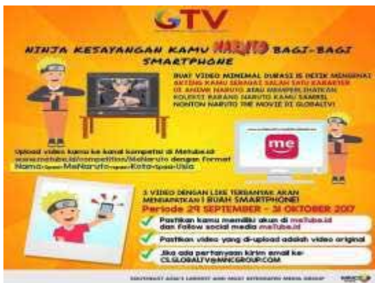
Gambar 1. Kuis Naruto di GTV

mengherankan bila kemudian anime ini berhasil menyabet penghargaan sebagai kartun favorit di Indonesia Kids Choice Awards 2015 dan Program Asing Terpopuler di ajang Indonesian Television Awards 2017.