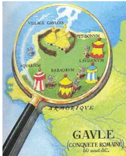
Gambar 6. Lokasi Desa Galia