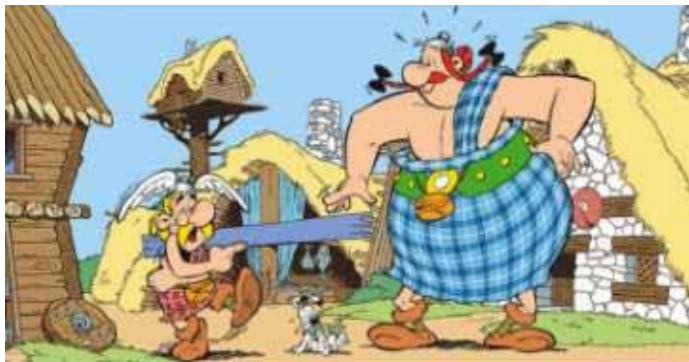
Gambar 4. Tokoh Astérix, Obélix, dan Idéfix

Komik ini bercerita tentang kehidupan Astérix dan teman-temannya yang hidup sekitar tahun 50 SM di sebuah desa fiktif di tepi pantai Armorik (dahulu daerah Galia kuno, sekarang dikenal sebagai Brittany atau Bretagne dalam bahasa Prancis). Desa ini menjadi istimewa karena merupakan satu-satunya bagian dari Galia yang belum berhasil ditaklukkan Julius Caesar dan legiun Romawinya. Penduduk desa itu memperoleh kekuatan super dari ramuan ajaib buatan dukun Panoramix. Satu sisi dari desa Galia ini dilingkupi pantai dan sisanya adalah hutan yang dijaga ketat oleh 4 garnisun tentara Romawi yang selalu memata-matai desa tersebut. Plot berulang dalam serial Astérix sering bercerita tentang usaha orang Romawi untuk mencegah sang dukun membuat ramuan ajaib atau memperoleh resep rahasianya untuk mereka sendiri. Usaha-usaha tersebut menjadi sia-sia di tangan para pahlawan dalam komik ini, yaitu si kecil Astérix yang riang dan cerdas, serta teman baiknya, Obélix, yang gendut dan baik hati tetapi agak pemalas. Kemudian pada Perjalanan Keliling Galia , mereka menemukan anjing kecil yang setia, Idéfix. Astérix sangat dipercaya oleh penduduk desa karena kejujuran dan kesetiiaannya pada kebenaran sehingga ia sering mendapatkan tugas-tugas penting di desa.