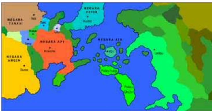
Gambar 5. Peta Negara-Negara dalam Dunia Naruto

elemen air sebagai jutsu (tenaga dalam) mereka. Desa ini juga tempat tinggal jinjuuriki (pemilik siluman dalam tubuh mereka) dari Bijuu ekor 3 yaitu Mizukage Yagura, sebelum ditarik keluar paksa lalu bebas di alam liar dan akhirnya ditangkap Deidara dan Tobi. Di masa lalu, Kirigakure terkenal karena sistem kelulusan akademi ninjanya yang amat kejam. Sistem tersebut mengharuskan setiap calon lulusan untuk menyerang, melukai, bahkan membunuh teman-teman seangkatan mereka. Namun sistem ini akhirnya dihapus setelah seorang siswa bernama Zabuza Momochi berhasil membunuh seluruh siswa angkatannya dalam tes ini.