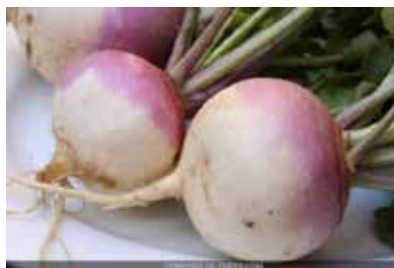
Gambar 2. Navet 'lobak'

Lobak memiliki makna peyoratif. Kata navet dapat digunakan untuk menandai penolakan film yang buruk untuk lolos, memperlakukan seseorang konyol, menjelaskan orang yang naif, mudah ditipu, perhitungan yang buruk. Konotasi negatif ini menciptakan ungkapan avoir du sang navet , yang memberi nuansa makna depresiatif (Amerlinck, 2006 : 100-101) . Lobak dalam perkembangan maknanya mengalami perubahan nilai. Pada Abad XIII, lobak merupakan bahan dasar masakan yang sangat terjangkau karena harganya yang murah dan mudah didapat. Setelah masyarakat Eropa mengenal kentang, lobak menjadi tidak berharga. Pada Abad XVIII, daging putih identik dengan kurangnya keberanian, sebagai lawan daging merah. Pada awal Abad XX, menggambarkan seseorang yang tidak memiliki kekuatan dan keberanian. Dalam linguistik Perancis, kata navet ' lobak ' menjadi contoh ilustrasi kata yang memperjuangkan "kelasnya".