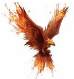
Gambar 1 Burung Phoenix

Berikut uraian semem makna ungkapan dan un oiseau rare :