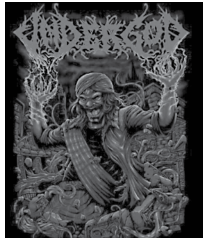
Gambar 04. Artwork band Undergod

Gambar 04. adalah hasil goresan artworker untuk band Jasad. Gambar tersebut memuat mayat hidup yang memakai iket serta membawa kujang atau senjata tradisional Sunda yang seolah-olah memuja Garuda. Nilai-nilai lokalitas disini terwakilkan dengan adanya pemakaian iket , kujang , bendera Indonesia, dan Garuda. Sedangkan gambar 05. adalah hasil gambar artworker untuk band Undergod. Gambar tersebut memuat tokoh pewayangan Sunda, Cepot, yang disketsakan dengan lebih garang dan bertenaga. Kedua gambar tersebut merupakan contoh dari beberapa hasil kerja para artworker yang ikut masuk pergerakan pengangkatan budaya lokal.