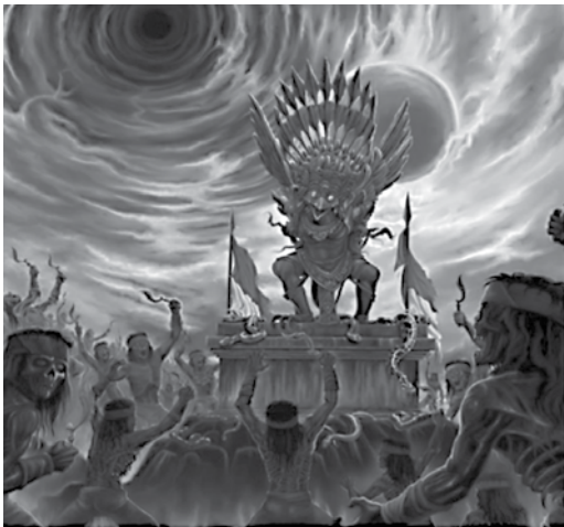
Gambar 04. Artwork band Jasad

Para artworker ini tentu saja mengikuti perkembangan permintaan pasar. Dengan adanya suatu tren pengangkatan budaya lokal oleh komunitas musik underground , membuat para artworker ikut ke dalam arus pergerakan. Penulis mencontohkan dua buah gambar dari artworker yang sudah mengalami akulturasi seperti berikut.