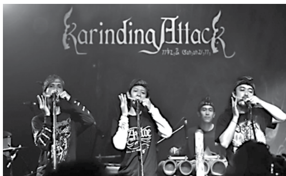
Gambar 07. Karinding Attack.

Berkat BDMS pula, alat musik tradisional tersebut kini menjadi tren baru di komunitas musik underground Bandung. Mereka dengan masif mempromosikan alat musik tersebut dengan membuat sebuah grup karinding celempong dengan nama Karinding Attack. Selain itu, mereka juga menggagas sebuah kelas untuk belajar karinding celempong , menjual instrumen tersebut di distro-distro hingga memproduksi rekaman tutorial memainkan karinding . Namun efek persebaran yang paling besar hadir oleh grup karinding celempong bernama Karinding Attack. Mereka menjadi idola baru bagi kalangan anak-anak muda Bandung pecinta musik underground , bahkan hingga anak-