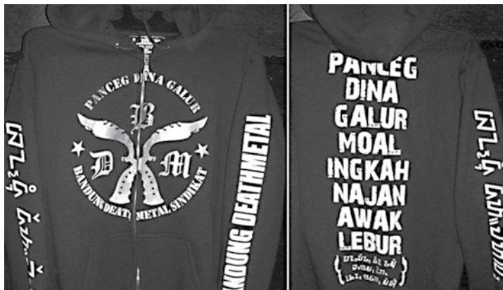
Gambar 06. Desain Jaket Bandung Death Metal Syndicate.

Moal Ingkaah Najan Awak Lebur” serta di bawahnya diberi tulisan aksara Sunda. Nampak ada sebuah kesadaran untuk mengedukasi tentang aksara Sunda terhadap masyarakat yang melihat. Secara tidak langsung, orang yang melihat produk ini menjadi tau aksara Sunda.