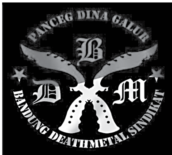
Gambar 01. Logo Bandung Death Metal Syndicate.