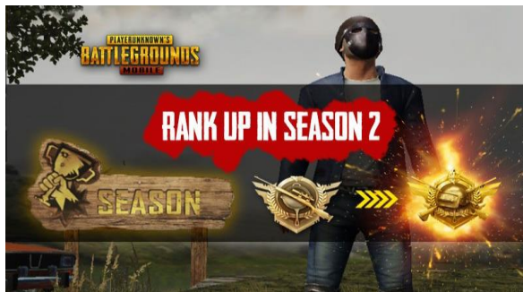
Gambar 7 Tampilan Hiperrealitas pada Level PUBG: RANK UP IN SEASON 2

sebagai pemula/ Beginner . Berikut gambar 9 tampilan Level dua Game Online PUBG yang dimainkan Siswa Prosus Inten Jalan Aceh Kota Bandung Tahun 2019.