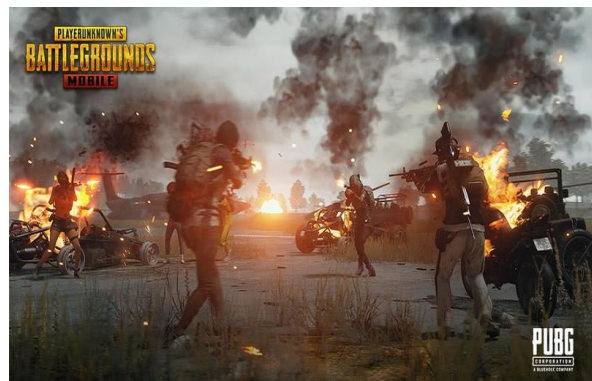
Gambar 3 Tampilan Simulakra pada Video Game Online-PUBG

simulakra dalam Game Online-PUBG, yakni (1) simulasi atau imitasi Games Online-PUBG yang ditampilkan meliputi visual tokoh utama (pemain), peralatan senjata perang, alam bebas, atau segala ikon yang disertakan dalam permainan tersebut dibentuk berdasarkan peniruan yang ideal. Mekanisme ini membentuk mereka untuk memilih, menggunakan, dan mengonsumsi permainan tersebut meskipun wujud yang dikonsumsi hanya berupa gambar tiruan yang bergerak “imitasi”. Hal inilah yang disebut Baudrillard sebagai masyarakat consumer ( the consumer of society ). Di mana masyarakat tak terlepas dari keinginan untuk mengonsumsi namun yang dikonsumsi hanyalah kepuasan semata bukan nilai guna; (2) Model simulakra dalam mekanisme tiruan gambar yang bergerak akhirnya menembus pikiran bawah sadar mereka sehingga menciptakan “makna” tentang jalan cerita (alur) permainan PUBG yang sarat dengan realitas semu atau citra-citra buatan. Berikut gambar 3 yaitu tampilan simulakra pada Video Game Online-PUBG.