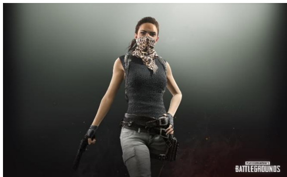
Gambar 4 Tampilan Style Feminin Game Online-PUBG

sebagai realitas PUBG. Realitas pikiran semu yang mereka alami adalah realitas buatan yang seolah-olah tampak kenyataan, padahal itu adalah citra buatan atau realitas semu. Pada kasus ini, contohnya siswa bermain seolah-olah menjadi “hero” yang punya power untuk survival dan perang (4) Signs/Simulacra menyamakan antara suara manusia dan komunikasi berbahasa lisan dan verbal serta style tokoh petarung PUBG yang seolah nyata menampilkan sosok “feminin” untuk memengaruhi sosok ideal sebagai wanita sungguhan. Suara dan style yang ditampilkan menunjukkan performa yang ideal guna memanipulasi kepalsuan. Contohnya, suara tokoh petarung perempuan bertubuh seksi dan cantik yang meniru persis seperti layaknya perempuan pejuang yang tangguh pada saat berperang. Berikut gambar 4 tampilan Style Feminin pada Game Online-PUBG .