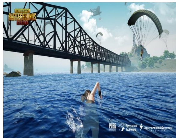
Gambar 5 Model Ideal Simulakra Game Online-PUBG

Biasanya dalam pembuatan simulasi menggunakan bantuan model manusia dengan berbagai konstruksi ideal yang menarik. Model yang dipilih untuk merepresentasikan PUBG memiliki standard atau syarat ideal seperti konstruksi maskulinitas yang memiliki tubuh yang kekar dengan wajah yang dianggap sangar dan tampan bagaimana layaknya pria militer dikonstruksi. Pemilihan dan penentuan warna tampilan PUBG ternyata juga diperhatikan untuk menunjukkan keaslian, kemudian biasanya PUBG dalam penampilan videonya menggunakan berbagai tema. Seperti tema gurun pasir yaitu vintage dengan warna yang kalem atau warna-warna pastel atau tema survival di hutan yaitu menampilkan aspek hutan yang dipenuhi binatang buas dan hutan belantara. PUBG juga menampilkan video gimnya dengan warna-warna ceria yang digambarkan dengan objek barang yang cerah atau corak yang ramai dan fantastis. Segala yang dilakukan PUBG tersebut sebenarnya juga berguna untuk menonjolkan apa yang dicitrakan sehingga mendukung gambaran imitasi agar terlihat lebih menarik dan menonjol seperti gambar (5) berikut ini: