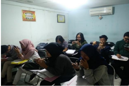
Foto Siswa Prosus Inten Jalan Aceh saat Jam Istirahat Bermain PUBG.