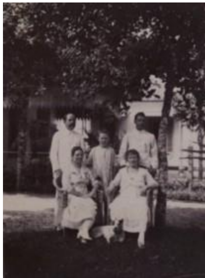
Gambar 1. Anjing dalam potret keluarga Eropa

penyakit rabies sejak akhir abad ke-19, terutama di Jawa dan Sumatera (Schimmel, 2015).