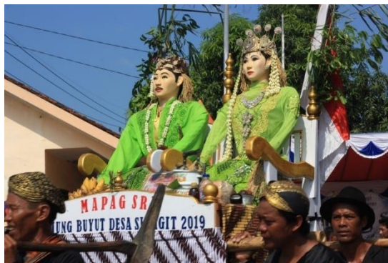
Gambar 1. Raden Budug Basu dan Dewi Sri di atas Bale Panjang dalam ritual sinoman .

Masyarakat Slangit menganalogikan perkawinan antara Budug Basu dan Dewi Sri adalah bersatunya nasi dan lauk pauk yang hendak dimakan atau dikonsumsi. Cerita mengenai Raden Budug Basu terdapat juga pada naskah Serat Satriya Budug Basu yang sebelumnya telah dibahas dalam penelitian Ridwan (2011). " Pengantin " dalam ritual sinoman tersebut bermakna perkawinan antara Dewi Sri dan Raden Budug Basu atau jika dilihat dari sudut pandang lain bermakna syukuran karena masyarakat Slangit dapat makan dari hasil panen padi yang akan segera tiba. Dalam mitos masyarakat Slangit Dewi Sri merupakan simbol dari nasi sedangkan Raden Budug Basu merupakan garam, lauk pauk atau teman nasi. Sehingga upacara adat Mapag Sri ini merupakan simbol " perkawinan " antara nasi dan lauk pauknya yang bersatu dalam satu wadah yaitu piring. Piring merupakan representasi dari Bale Panjang , tempat yang mempersatukan Dewi Sri dan Budug Basu.