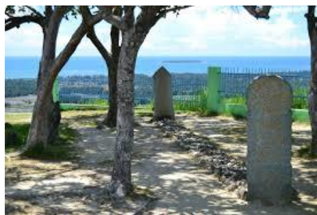
Gambar 1. Kompleks Makam Papan Tinggi yang langsung berhadapan Samudra Hindia

Terdapat 36 buah batu nisan berinskripsi yang ditemukan di Barus. Kesemua nisan tersebut ditemukan pada beberapa pemakaman kuno di Barus. Pemakaman-pemakaman kuno tersebut antara lain, kompleks makam Ibrahim, kompleks makam Ambar, kompleks makam Maqdum, kompleks makam Maligai dan pemakaman Papan Tinggi. Nisan-nisan berinskripsi ini umumnya berbahasa Arab, Persia dan juga Melayu. Tulisan yang digunakan dalam penulisan nisan-nisan ini adalah aksara Arab yang terpengaruh dari beberapa daerah Islam seperti India atau Persia. Nisan-nisan ini umumnya memberikan informasi mengenai identitas orang yang dikuburkan serta puisi atau karya sastra yang sezaman dengan sang nisan. Berdasarkan kajian epigrafis dari pelbagai nisan, peneliti menyimpulkan beberapa isi dari nisan-nisan tersebut. Pada beberapa nisan dapat ditemui beberapa unsur lokal yang dapat dilihat pada pengayaan nisan serta penggunaan bahasa Melayu. Pada beberapa nisan dapat ditemui ayat-ayat Al-Quran yang menceritakan perihal penghormatan terhadap wali-wali Allah, ketenangan jiwa serta keagungan Allah. Selain itu karya-karya sastra (terutama dari kesusastraan Persia) seperti puisi atau syair ditemukan pada beberapa isi nisan (Kalus, 2017: 297-331).