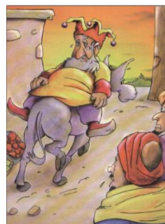
Gambar 5. Hukuman yang otoriter (Asy-Syaruni, 2008: 25)