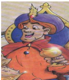
Gambar 1. Ilustrasi busana raja (Asy-Syaruni, 2008: 28)