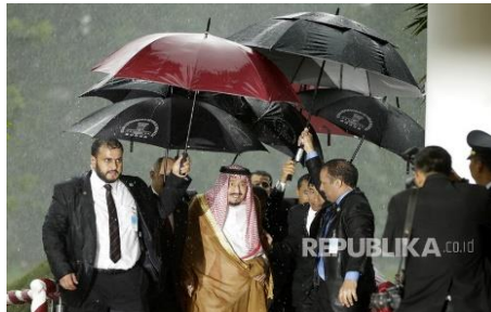
Gambar 3. Raja Arab Saudi dengan busana bishtnya

Salman, dalam berbagai aktivitas kenegaraan, salah satunya saat momentum kunjungannya ke Indonesia pada tahun 2017 berikut ini: