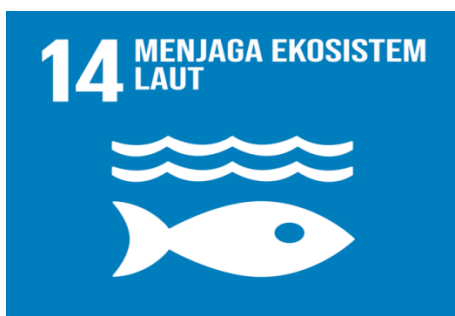
Gambar 2. SDG's No 14