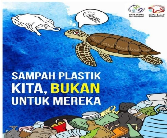
Gambar 3 Poster

Poster 2 adalah poster yang diambil dari laman Kementerian, Kelautan dan Perikanan (KKP). Poster 2 memiliki keterkaitan dengan poster 1 yang diambil dari laman TPB (SDG’s) Indonesia nomor 14, yang memiliki tanda berupa tulisan