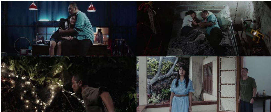
Gambar 7. Upaya Bapak menanggapi rasa bersalahnya dan May berdamai dengan traumanya (Sumber: 27 Steps of May )

Upaya penyajian isu bapakisme dalam membicarakan masalah perempuan selanjutnya juga tampak dari cara May dan Bapak berdamai dengan trauma dan rasa bersalahnya.