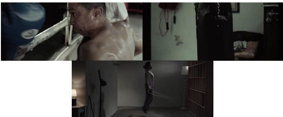
Gambar 2. Bapak dan May melakukan aktivitas fisik

Penggambaran fatherhood tradisional sebagai pembangun bapakisme selanjutnya diperlihatkan melalui adegan Bapak dengan pekerjaan sekundernya, yakni sebagai petinju, juga May yang sedang melakukan aktivitas lompat tali ( skipping ). Dalam menampilkan adegan tinju, film menyajikan penggambaran tinju sebagai aspek maskulinitas hegemonik yang berkaitan dengan kekerasan, serta aspek fatherhood tradisional yang berkaitan dengan pemberian aktivitas fisik bapak terhadap anaknya.