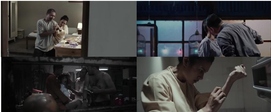
Gambar 6. Pelanggaran yang dilakukan Bapak dan Pesulap terhadap May memicu memori traumatis May

May merupakan penyintas gang rape menunjukkan situasinya kembali muncul ke permukaan yang oleh film ditampilkan melalui pelanggaran tokoh lain, khususnya Bapak dan Pesulap, terhadap tubuh dan ruang aktivitasnya. Gambar 6 bagian kiri atas memperlihatkan adegan ketika Bapak berupaya menyelamatkan May dari bencana kebakaran secara terpaksa menyeret May keluar dari kamarnya. Bila diamati, tangan kanan Bapak tampak menggenggam kuat tangan kanan May yang menunjukkan pelanggaran tokoh Bapak atas tubuh May melalui kekerasan. Reaksi May yang melakukan penolakan terhadap tindak kekerasan Bapak oleh film dihubungkan dengan adegan kilas balik ( flashback ) memori traumatis May seperti tampak pada gambar 6 bagian kiri bawah. Hal yang serupa ditampilkan oleh film dalam adegan Pesulap yang tampak mencium pipi May (gambar 6 bagian kanan atas). Terdapat pula penyajian pelanggaran oleh tokoh laki-laki terhadap ruang dan tubuh perempuan yang dihubungkan oleh film dengan adegan flashback pemerkosaan May oleh sekelompok laki-laki tak dikenal. Selain merupakan pihak yang dilanggar, film juga menunjukkan peminggiran terhadap tokoh perempuan melalui tokoh May yang mengurung dirinya dalam kamar mandi untuk menyayat tangannya (gambar 6 bagian kanan bawah).