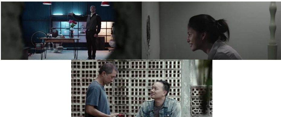
Gambar 3. Pertunjukkan trik sulap oleh Pesulap terhadap May dan pemberian saran oleh Kurir pada Bapak tentang situasi May

Tokoh Pesulap dan Kurir dalam film ini tampak menjadi awal mula digerakkannya keseharian Bapak dan May yang kaku; Pesulap digambarkan menampilkan trik sulap dan lebih banyak berinteraksi dengan May, sementara Kurir digambarkan menjadi pihak yang memberi saran terhadap Bapak untuk mengatasi situasinya dan situasi May. Adapun atribusi fatherhood yang tampak ditunjukkan melalui tokoh lain yakni aspek keterlibatan, pendampingan, dan dukungan moral terhadap anak.