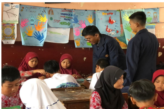
Gambar 3. Sesi mentoring pada Kegiatan PPM

Cerita legenda Nusantara memiliki potensi besar dalam menumbuhkan literasi siswa sekolah dasar. Selain mengajarkan nilai-nilai moral, cerita legenda juga dapat memperkuat rasa nasionalisme dan cinta tanah air pada siswa. Dengan pendekatan yang tepat, cerita legenda Nusantara dapat menjadi instrumen efektif dalam menarik minat baca dan meningkatkan literasi siswa sekolah dasar di Indonesia.