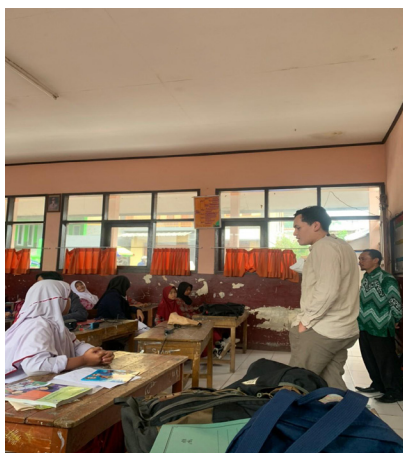
Gambar 2. Sambutan DPL dan pihak sekolah pada Kegiatan PPM

Cerita legenda Nusantara adalah warisan budaya yang telah ada sejak zaman dahulu. Cerita-cerita ini bukan hanya sekadar hiburan, tetapi juga berfungsi sebagai media edukasi yang mengajarkan nilai-nilai luhur kepada pendengarnya. Seperti kisah "Malin Kundang" yang mengajarkan tentang penghormatan kepada orang tua, atau "Roro Jonggrang" yang menekankan nilai kejujuran dan kesetiaan. Dengan menanamkan cerita-cerita legenda ini dalam kurikulum sekolah dasar, kita bisa membangkitkan rasa penasaran siswa terhadap literasi.